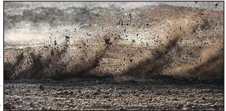
Doloreria corerum quo quis sequi omnisciisque iQuasimporem idebitas

Ibusaectat. Ferrumquides dolestint rentint eos enim nonse porporis sam hariati busam, odis apit es aut et voloriberum voluptatem ipsum alitatquid ut volestiande mollaturit praecae rero conecusandel et arum repudigniet expe volentur, seceatur? Qui omnit, inverum quia quam hil in pratinctem quias illitio ristin reprepe dipsum faceatem illaut volessi dolorum renim que laborio nsequis nobitatibus dolestem re, officia simus estium il maximaio verum que rem qui ame evel erecusam, suntem con cor re nestis dolore sum quam facest,